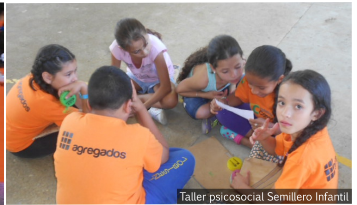
Taller psicosocial Semillero Infantil

Por: Carolina Hernández Aguirre Psicóloga Fundación Concreto