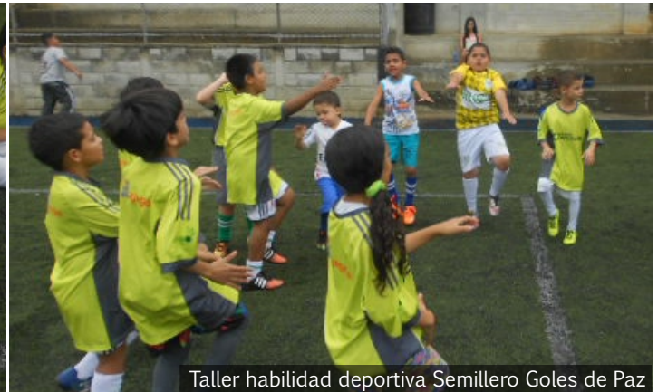
Taller habilidad deportiva Semillero Goles de Paz

Por: Oscar Alejandro Valencia Orozco Auxiliar de Proyectos Fundación Concreto