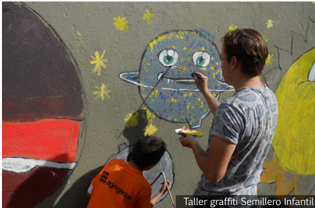
Taller graffiti Semillero Infantil