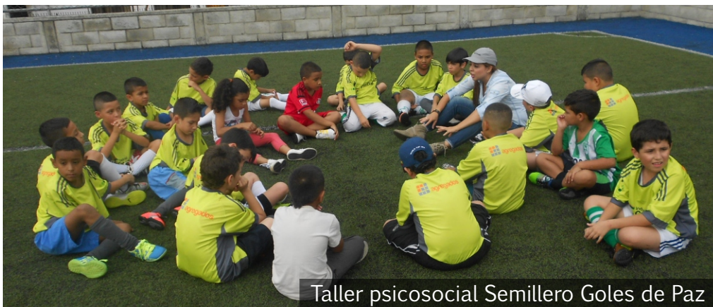
Taller psicosocial Semillero Goles de Paz

El proceso formativo que adelantan los niños y niñas del semillero Goles de Paz, a través de la práctica del deporte, se ha caracterizado por la aplicación de técnicas de autocontrol emocional, lo que les ha permitido fortalecer el valor del respeto y el desarrollo de la cultura del buen trato con sus compañeros. Igualmente, por medio de los talleres formativos, los participantes son orientados a la aceptación de normas y reglas que promueven y regulan una mejor convivencia.