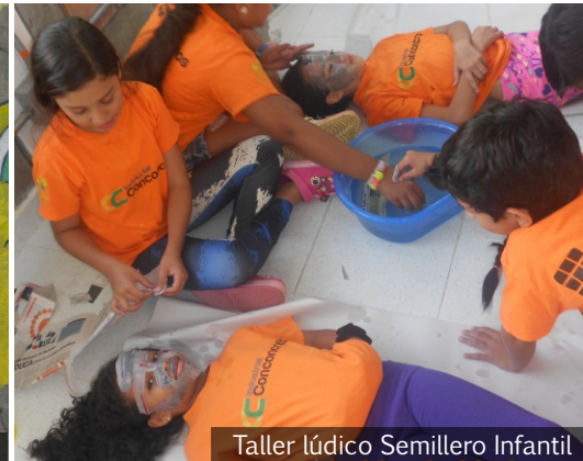
Taller lúdico Semillero Infantil

Por: Oscar Alejandro Valencia Orozco Auxiliar de Proyectos Fundación Concreto