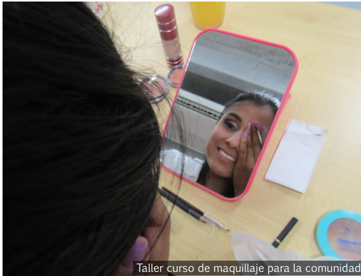
Taller curso de maquillaje para la comunidad