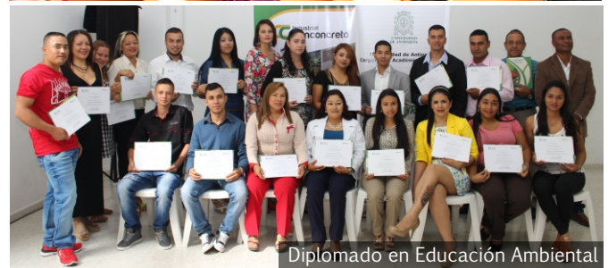
Diplomado en Educación Ambiental