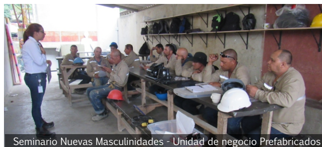
Seminario Nuevas Masculinidades - Unidad de negocio Prefabricados