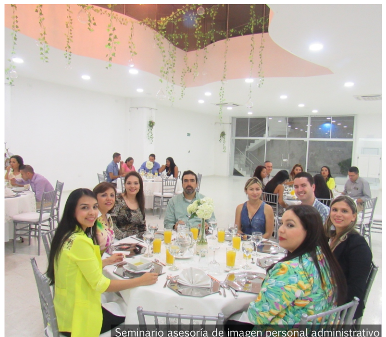
Seminario asesoría de imagen personal administrativo