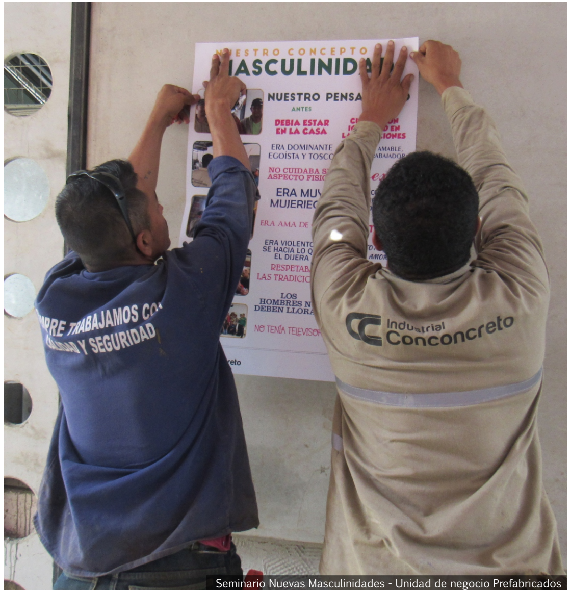
Seminario Nuevas Masculinidades - Unidad de negocio Prefabricados

Cada día se reconoce más la necesidad y la conveniencia de la participación de los hombres y su corresponsabilidad frente a los roles que tradicionalmente desempeñaban las mujeres, como lo son las tareas domésticas, reproductivas y de cuidado, especialmente en el cuidado y crianza de los hijos. Pág.1