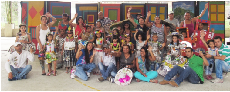
El Festival Ambiental se realizó en el mes de abril, en la cancha del barrio Montecarlo