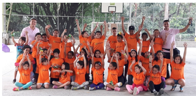
Las actividades se realizan los días miércoles de 2:30 PM a 4:30 PM en la placa deportiva del barrio Montecarlo.

La metodología aplicada en cada uno de los talleres formativos es aprender – jugando y aprender – haciendo, donde los participantes fortalecen valores y habilidades para la vida como la comunicación asertiva y el manejo de emociones.